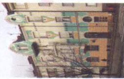
rodný dům Adiny Mandlové